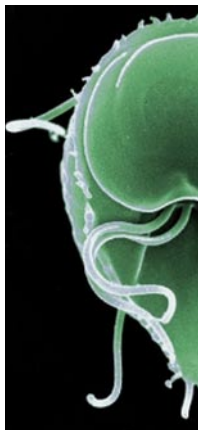
Giardia is voorkomende infectie in

Op basis van antistoffen kunnen parasieten in ontlasting, urine en bloed met behulp van een ELISA test snel worden opgespoord. Voor malaria, een bloedparasiet, is deze test inmiddels opgenomen in de protocollen voor diagnostisch onderzoek. Met name voor de kleinere laboratoria is deze techniek een uitkomst, vindt Mank. "Microscopisch onderzoek vereist vakkennis en veel tijd. Als in het weekend iemand die net uit Togo terug is in het ziekenhuis terechtkomt vanwege erg hoge koorts en